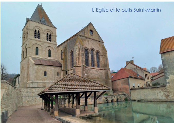
L'Eglise et le puits Saint-Martin

Avec l'Agglo, dans le cadre de l'Opération de Revitalisation du Territoire "Petites Villes de Demain".